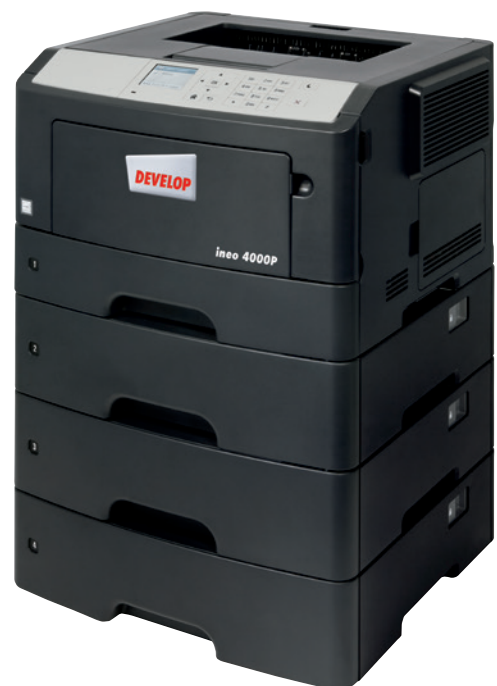
ineo 4000P s tromi ďalšími zásobníkmi papiera (PF-P11)

Ak je ovládanie vašej súčasnej tlačiarne komplikované a je náročné ju používať, je na čase vymeniť ju za tlačiareň ineo 4000P. Jej 6-centimetrový farebný displej zaisťuje intuitívnu obsluhu a zvýraznené menu zobrazuje užívateľom stav tlačiarne, možnosti obsluhy a nastavenia. A čo viac, koncept navigácie v štýle záložiek značne zjednodušuje obsluhu ineo 4000P oproti mnohým starším zariadeniam. To šetrí váš čas a úsilie vašich zamestnancov pri každodennom tlači.