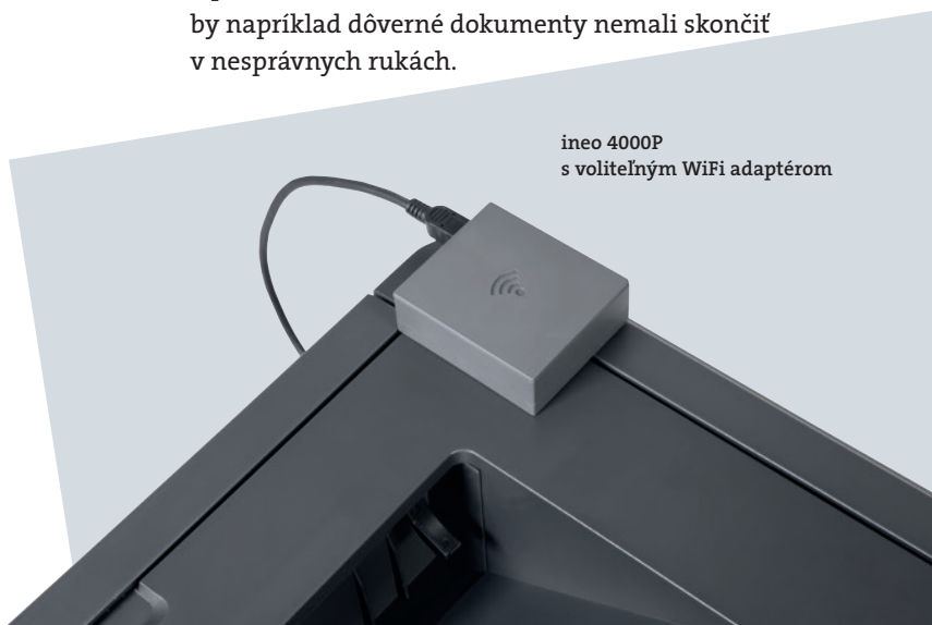
ineo 4000P s voliteľným WiFi adaptérom

Ak vo vašej kancelárii nie je veľa miesta alebo potrebujete špeciálnu stolovú tlačiareň, práve malé rozmery a nízka hmotnosť sú veľkými výhodami tlačiarne ineo 4000P. Skutočnosť, že túto efektívnu kancelársku tlačiareň je možné ľahko umiestniť na stôl a nepotrebuje vlastný priestor, je veľmi pohodlná pre pracovníkov v personálnom alebo finančnom oddelení, kde by napríklad dôverné dokumenty nemali skončiť v nesprávnych rukách.