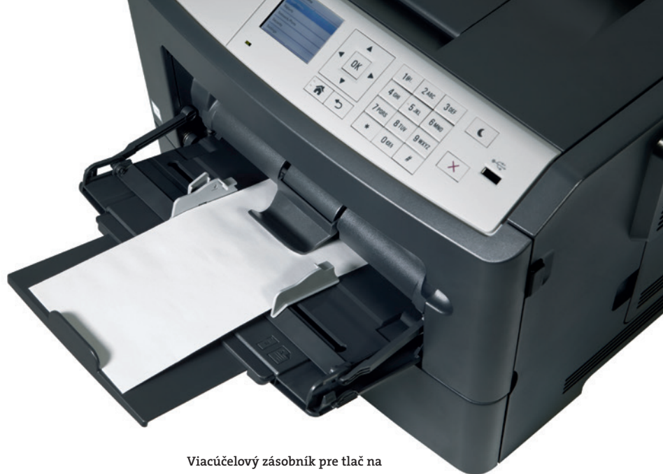
Viacúčelový zásobník pre tlač na špeciálne médiá, napríklad obálky

* Poznámka: zásobníky papiera PF-P11 alebo PF-P12 môžete ľubovoľne kombinovať do max. počtu 3 voliteľných zásobníkov.