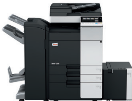
ineo + 258 s duálnym podávačom (DF-704), brožúrovacím finišerom (FS-534SD), veľkokapacitným zásobníkom (LU-302) a systémovým stolíkom (PC-410)