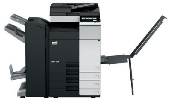
ineo + 258 s duálnym podávačom dokumentov (DF-704), brožúrovacím finišerom (FS-534SD), podávačom na baner (BT-C1e) a systémovým stolíkom (PC-210)