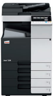
ineo + 258 s duálnym podávačom (DF-704) a systémovým stolíkom (PC-210)

Investujte do zariadenia ineo + 258 a už viac nebudete musieť chodiť do tlačiarne, aby ste si napríklad vytlačili zopár pozvánok na kvalitný hrubý papier. To vám ušetrí čas aj peniaze. Develop ineo + 258 zvládne obálky, recyklovaný papier, predtlačený papier, projekčné fólie a mnoho ďalších médií s hrúbkou až do 300 g/m 2 . Zároveň je možné tlačiť na širokú škálu formátov papiera od A6 až po A3 + (SRA3) alebo na banerový papier s dĺžkou 1,2 metra. Doplnením o finišery získate možnosť tlačiť brožúry s veľkosťou až 80 strán, skladať listy rôznymi spôsobmi (napr. pol-sklad, listový trojsklad), zošívať listy v rohu či po strane alebo listy dierovať pre jednoduché skladovanie dokumentov v zakladačoch. Takmer každá tlačová úloha môže byť urobená priamo vo firme na zariadení ineo + 258.